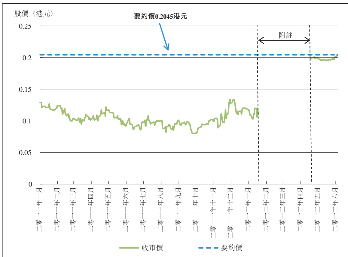
圖A：股份於回顧期之收市價

下圖載列股份自二零一一年一月三日(即最後交易日前12個曆月期間之首個交易日)直至及包括最後可行日期止期間(「回顧期」)於聯交所之每日收市價。